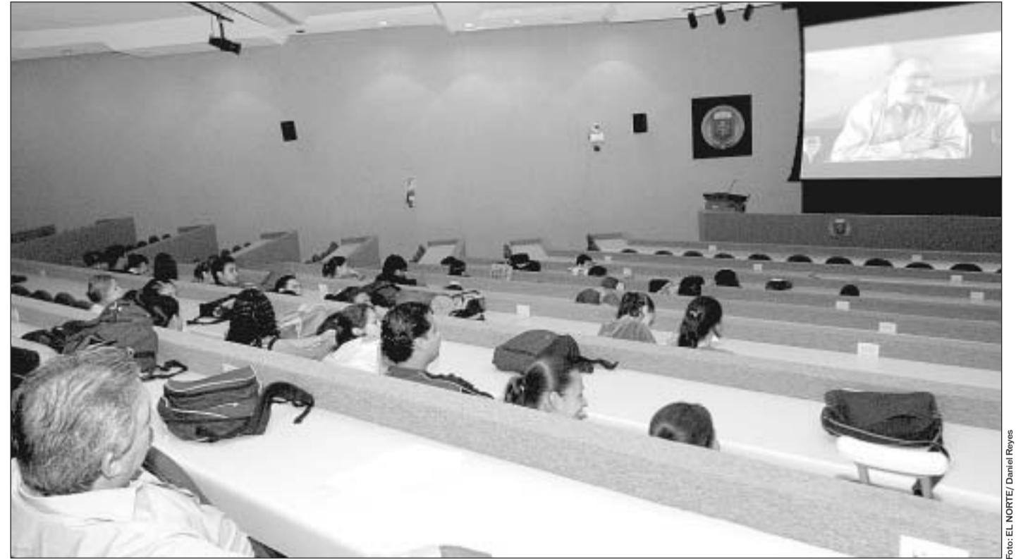
Por cuestiones de horario, los asistentes sólo presenciaron la segunda parte del panel, que inició sus transmisiones en la UANL a partir de las 8:30 horas.

La conferencia "El valor de la palabra: Literatura y Memoria" fue el primer evento del Foro transmitido en tiempo real a estudiantes de la Facultad de Filosofía y Letras el martes 18 de este mes en el auditorio