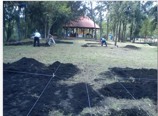
Fig.3. Levantamiento en campo del jardín JPMAX.