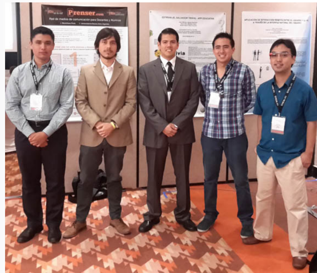
Jóvenes innovadores, TICAL2014

¿Cuáles serán tus próximos pasos con relación a la iniciativa que presentaste en TICAL?