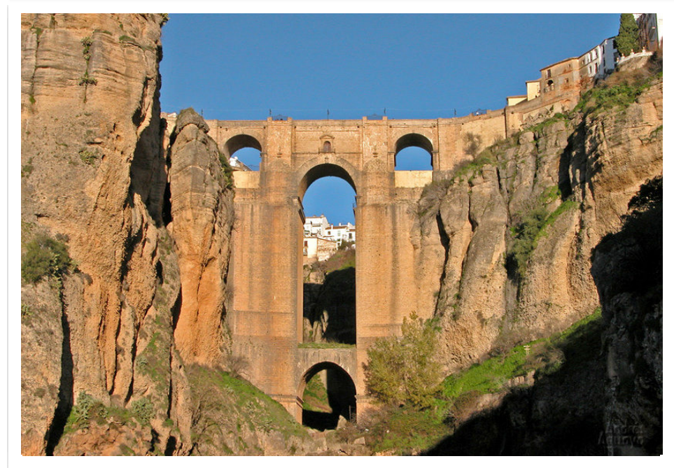
Copy Turismo Ronda

Para su 27 edición en 2014, la ASECIC asume su completa gestión, con una amplia difusión a través de sedes y subsedes conectadas por la RedIRIS de España y RedCLARA de América latina.