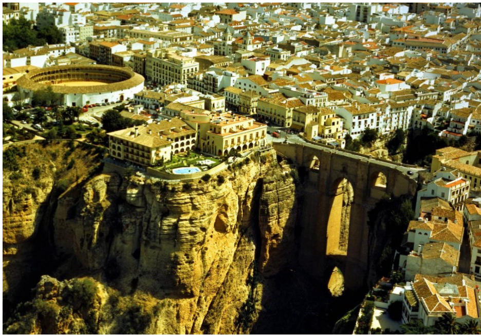
Copy Turismo Ronda

Más allá de ser una ciudad reconocida globalmente por su enorme patrimonio cultural, histórico y turístico, Ronda es también - desde 1977- la sede de la Bienal Internacional de Cine Científico (BICC) , el certamen audiovisual pionero en España y Europa dedicado a mostrar las mejores imágenes y sonidos de la ciencia y tecnología del mundo.