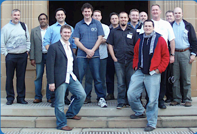
Equipo de AARNET.

En septiembre de 2008 conocí a Klaas Wierenga, presidente del TF-Movilidad, en una conferencia en Melbourne, Australia. Ahí Klaas compartió célebremente una idea en la lista de correos – ver: https://www.terena.org/mail-archives/mobility/msg00062.html -, esta idea se convirtió en eduroam.